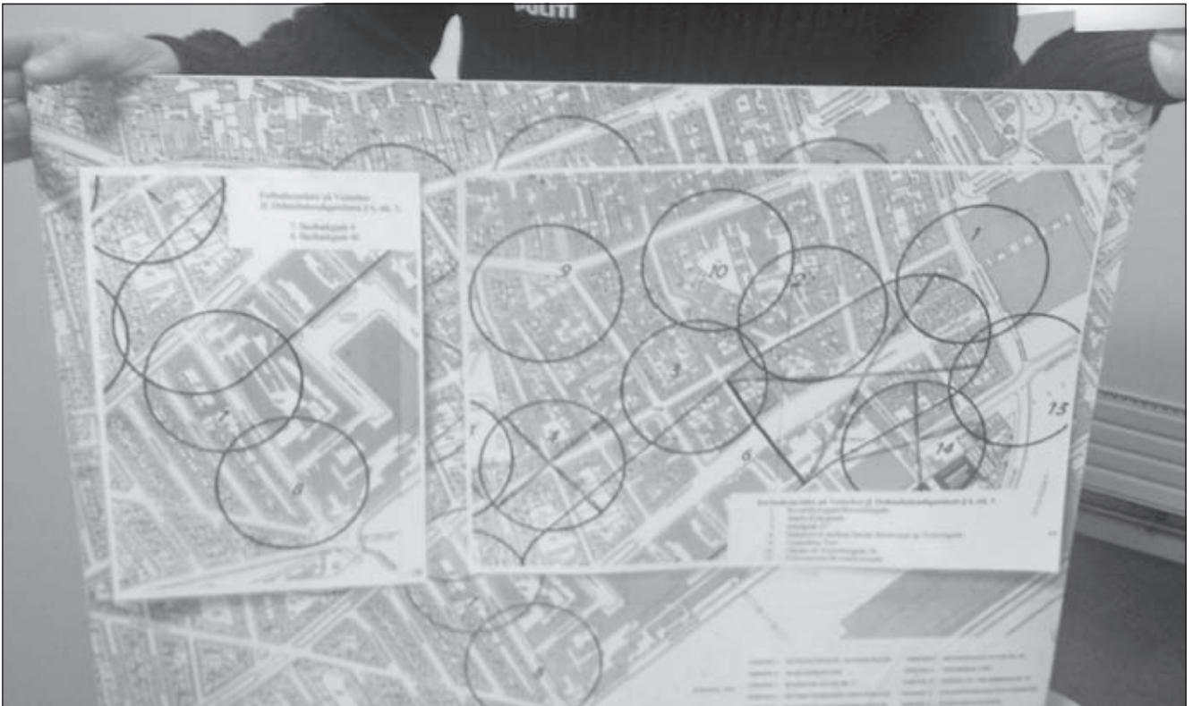
En betjent viser, hvordan Vesterbro er indrettet i forbudszoner.

sesfrihed, herunder til selv at tage ophold, hvor man ønsker. Gadejuristen mener, at politiet kører et system, som efterhånden lever sit eget liv og ikke er i overensstemmelse med ordensbekendtgørelsen bestemmelser.