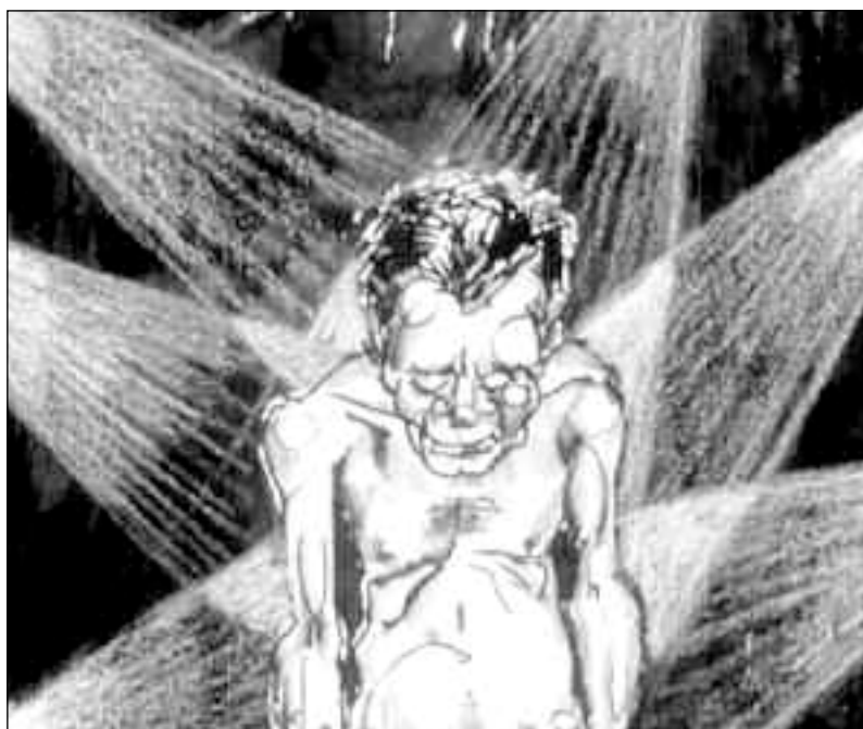
ILLUSTRATION STILLET TIL RÅDGIVNING AF REHABILITERINGS OG FORSKNINGSCENTRET FOR TORTUROFRE (RCT)