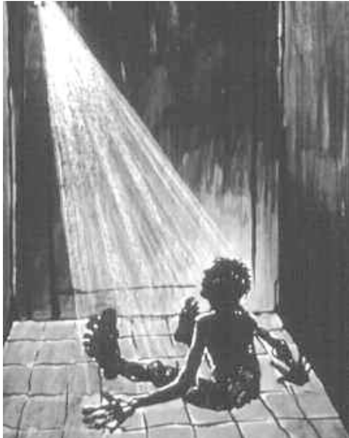
ILLUSTRATION STILLET TIL RÅDGIVNING AF REHABILITERINGS OG FORSKNINGSCENTRET FOR TORTUROFRE (RCT)