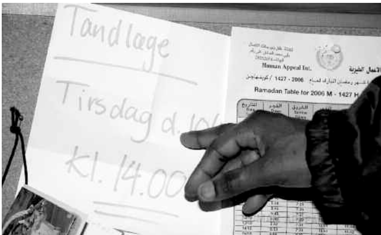
Der bliver lagt sedler – det hjælper både på sproget og integrationen i det danske samfund.