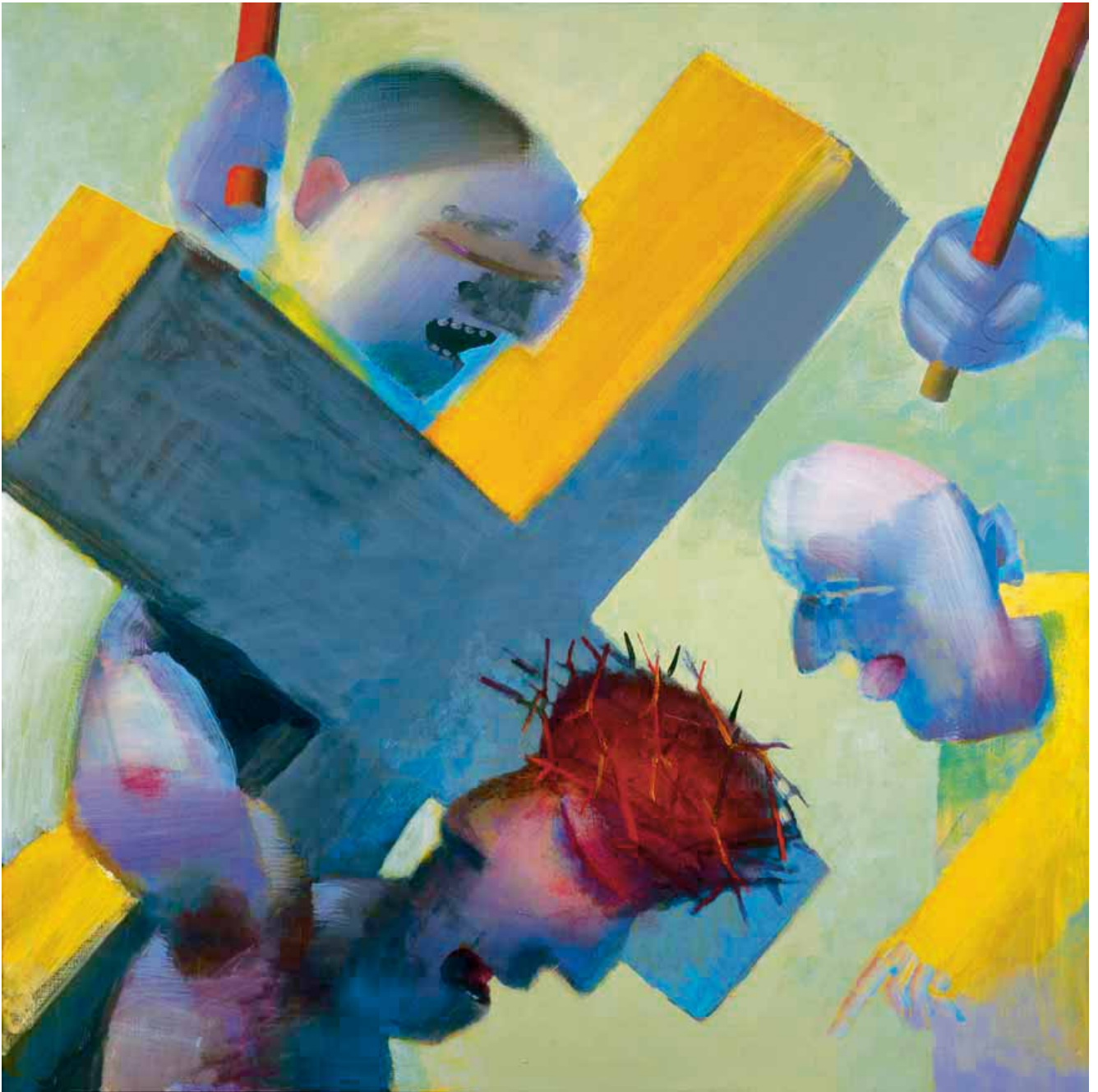
Der skal også mod til at lave en korsfæstelse, for der er lavet så utroligt mange og stærke ting i forvejen. Man skal kunne sige noget nutidigt, som ikke er lavet i forvejen, siger Arne Haugen Sørensen. Her fortolker han sætningen "Han bar selv korset", Lukas 19,17 i Korsbæreren fra 2006. Privateje H.M. Dronningen. (Se artikel s. 7-8)