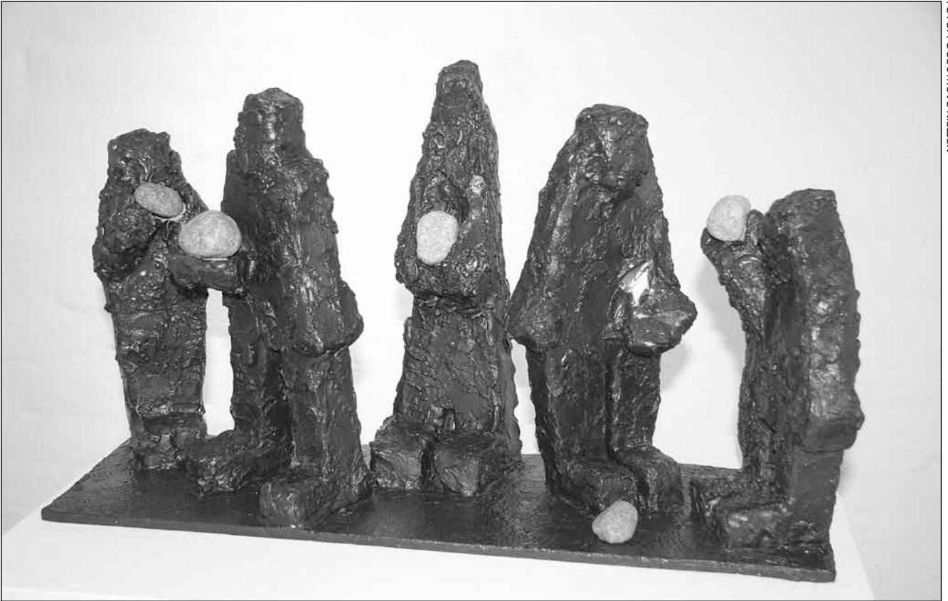
»Den af jer, der er uden synd, skal kaste den første sten på hende.«