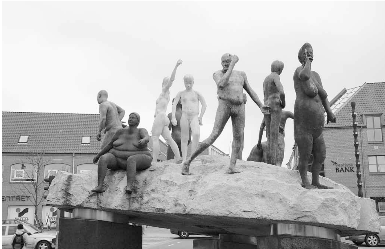
De 12 figurer af Bjørn Nørgaard i Holstebro er blevet udvalgt ligesom de første 12 disciple og alle dem, der får en tår over tørsten i Enghaven.