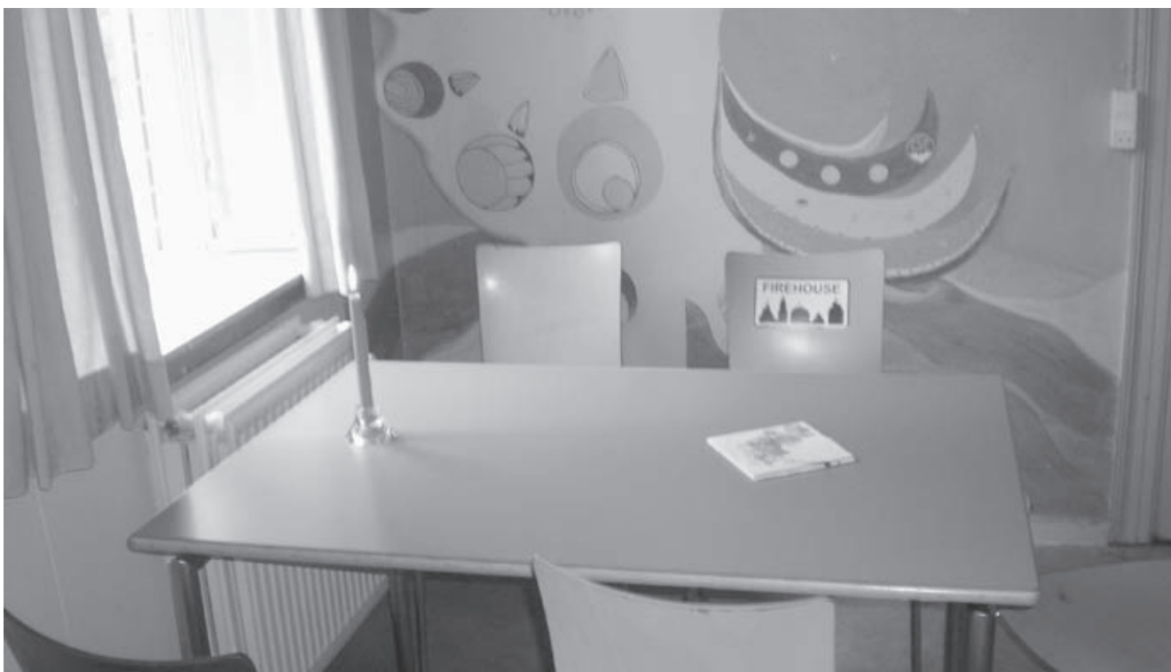
Presset på faciliteterne i Kirkens Korshærs varmemstue i Stengade 40 er øget markant med tilstrømningen af nye brugergrupper.

Korshærsleder Annemette Nyfoss holder foredrag søndag den 5. september kl. 10.30 på Kirkens Korshær Årsmøde på Hotel Nyborg Strand.