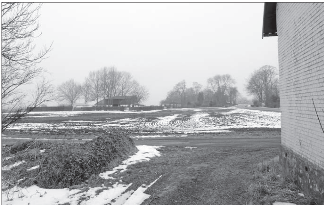
Lolland. Marts 2011.

det er os, som er kommet her, fordi vi fik stillingerne, som tager styringen. Men vi har også en forpligtelse. Sådan føler jeg det i hvert fald, siger han.