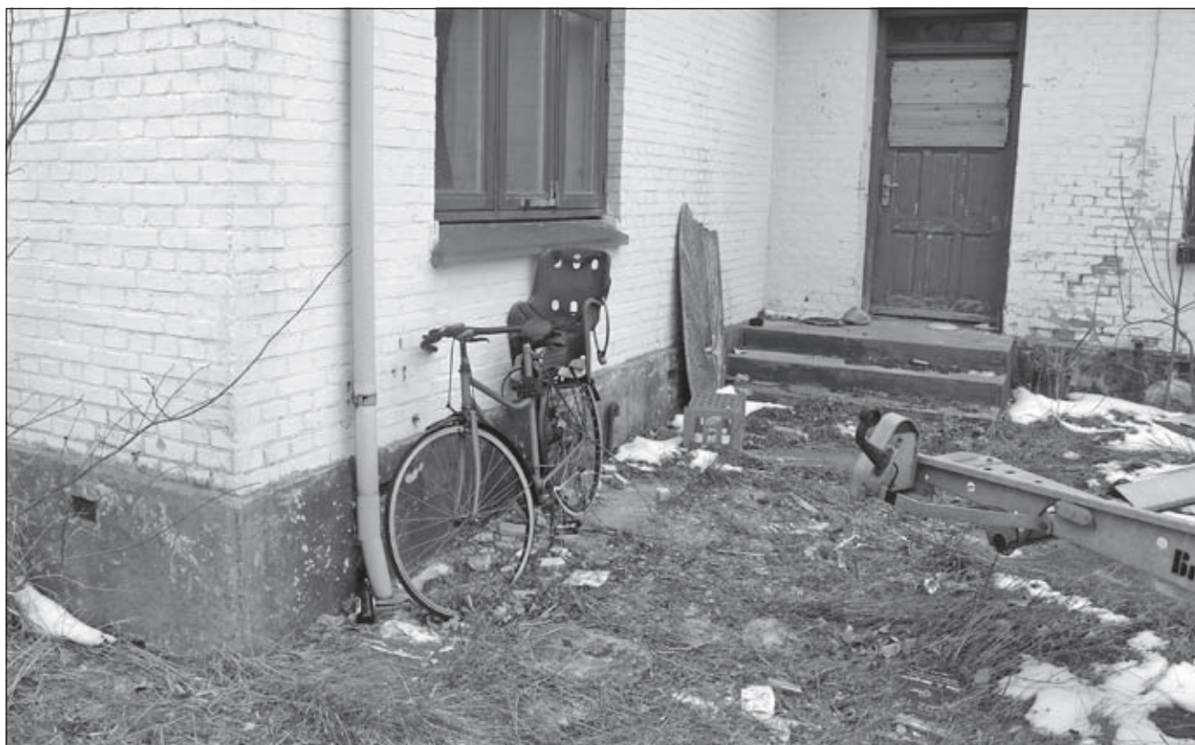
Bygningen ved siden af kirken er slemt forfalden. Engang var det landsbyens skole. Siden har den været vidne til misbrug og tvangsfjernelser.