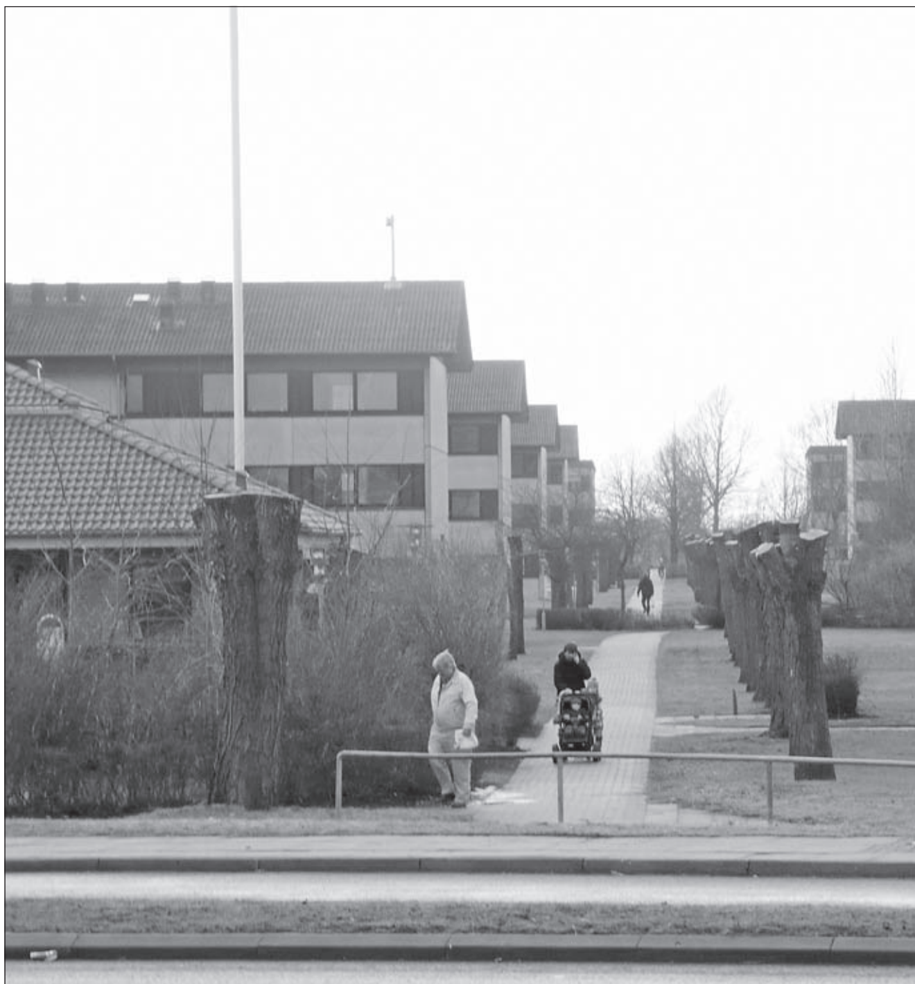
230 af Boligselskabet Danbos 1500 lejligheder i Havnbjerg står tomme.

Det var så multietnisk et samfund, som danskere nu kan skabe. Sprogligt har området altid været en slagmark mellem sønderjysk, alsisk, tysk og rigsdansk.